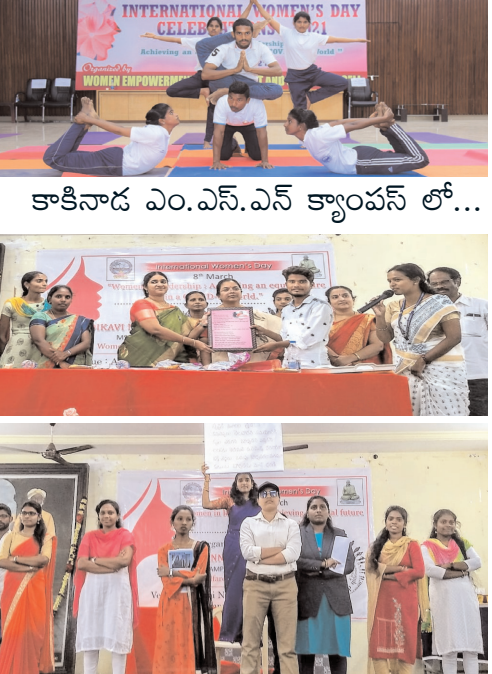
కాకినాడ ఎం.ఎస్.ఎస్ క్యాంపస్ లో...