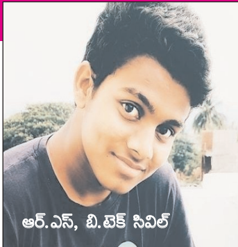
ఆర్.ఎన్. బి. టెక్ సివిల్

బాల్యంలో బాధను నీదరి చేరనీయక గుండెల్లో నిన్ను పదిలంగా పెంచిన అమ్మ బుణం కాస్తయినా తీర్చుకోవాలనే యోచన నీలో మెదులుతొందా.. నీ చదువుకై, వివాహానికై అప్పులు, అనుమానాలు మూటగట్టుకొని ఆ మూటని చిరునవ్వుతో కప్పేసిన నీ తండ్రికి చివరి రోజుల్లో కాస్తయినా ప్రేమను పంచాలనే ప్రయత్నం నీ మదిలో మెదులుతొందా.. చివరకు మృత్యువు ఒడిలో గతాన్ని పిండితే రాలిన జ్ఞాపకాలు ప్రశ్నించవా.. నీ జీవన విధానాన్ని దాని సార్థకతను.